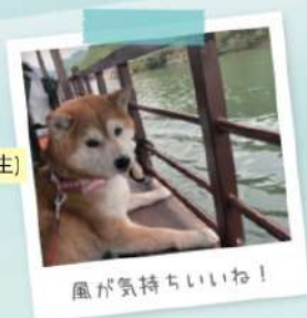
風が気持ちいいね!

料金 大人 /4,000 円・食事付 (税込) 子供 /3,000 円・食事付 (税込) (4歳~小学生) ワンちゃん /1,000 円 (税込)