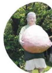
この中に桃太郎がいるんだね