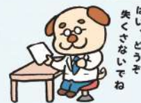
はい、どうやら失くさないですね